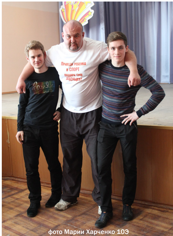
фото Марии Харченко 10Э

Показательное выступление для учащихся гимназии №2 Иван Савкин провёл неделю спустя. Во дворе школы собралось много зрителей, которые поддерживали Ивана криками. Спустя несколько минут