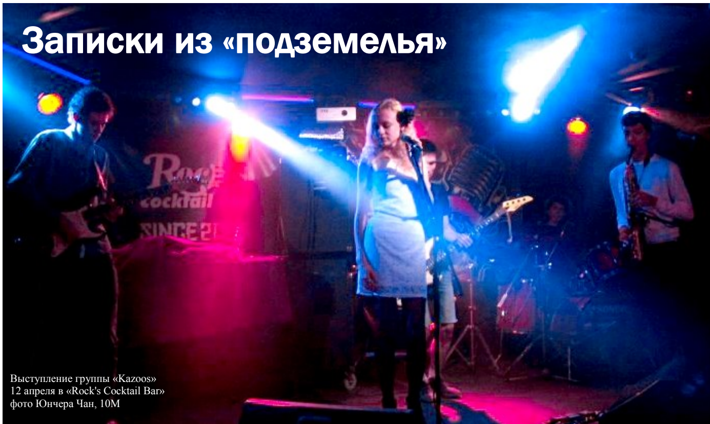
Выступление группы «Kazoos» 12 апреля в «Rock's Cocktail Bar» фото Юнчера Чан, 10М

На часах почти 21.00. Спускаясь по лестнице в место, выглядящее весьма сомнительно, меня тревожила лишь одна мысль: «А вдруг на входе не пропустят в силу моего возраста?». Затаив дыхание, подхожу к гардеробной. «Ваше пальто, пожалуйста», – сказал мне угрюмый мужчина, и я спокойно выдохнула.