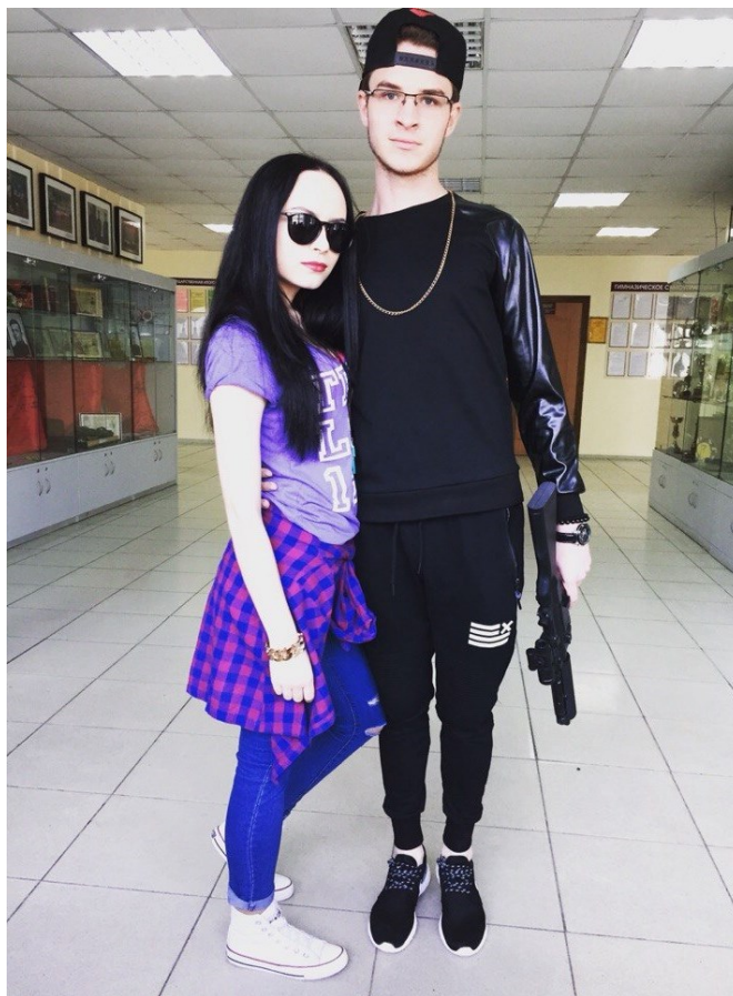
На второй день выпускники стали «бандитами»

Подтяжки и галстуки, разноцветные банты и яркие колготки, подобные тем, что мама надевала на нас в детстве, всё это можно было увидеть в этот день на учениках одиннадцатых классов. И хотя тема дня была общей, некоторые ребята сделали акцент на сонных деткишках, и пришли в школу в домашних тапочках, укутанные мягкими пледами. Казалось бы, в таком наряде можно и уснуть где-нибудь на стульях, но нет, «мальчиш» не скуцали ни минуты: веселились, фотографировались, бегали и смеялись, как настоящие первоклассники!