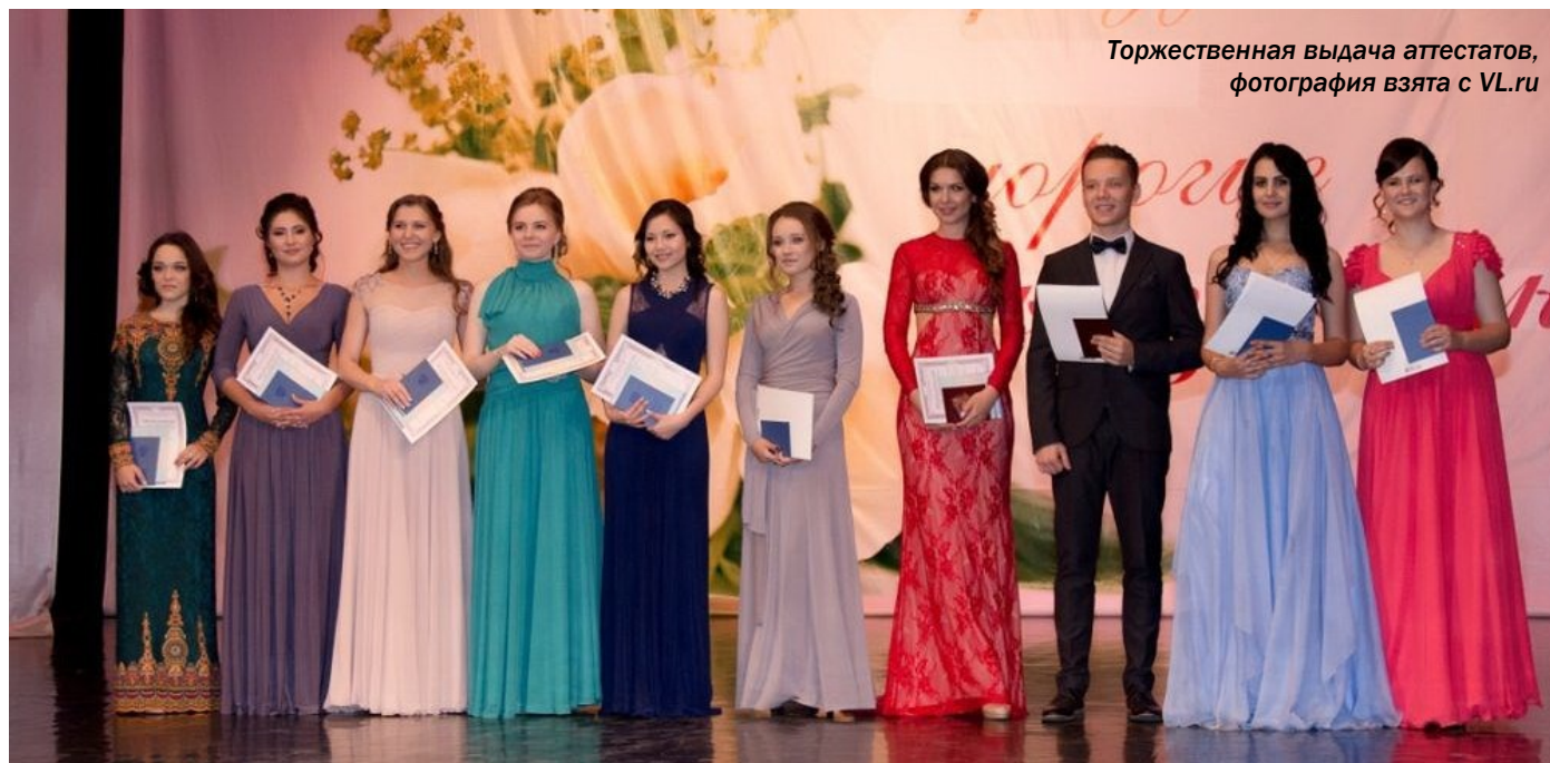
Торжественная выдача аттестатов