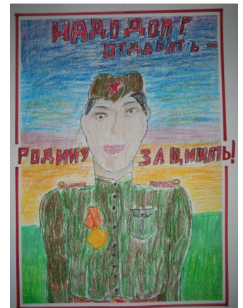
Рисунок Червонной Вероники, 3В