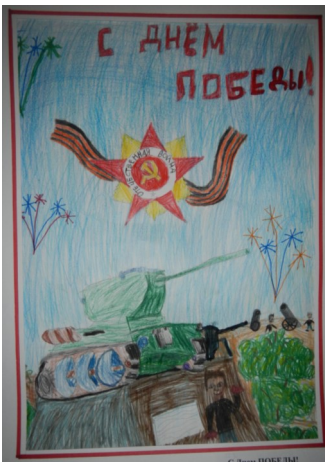
Рисунок Лейбенко Георгия, 3В

После этого вернулся домой в 1944 году. Был награждён медалями и ор-